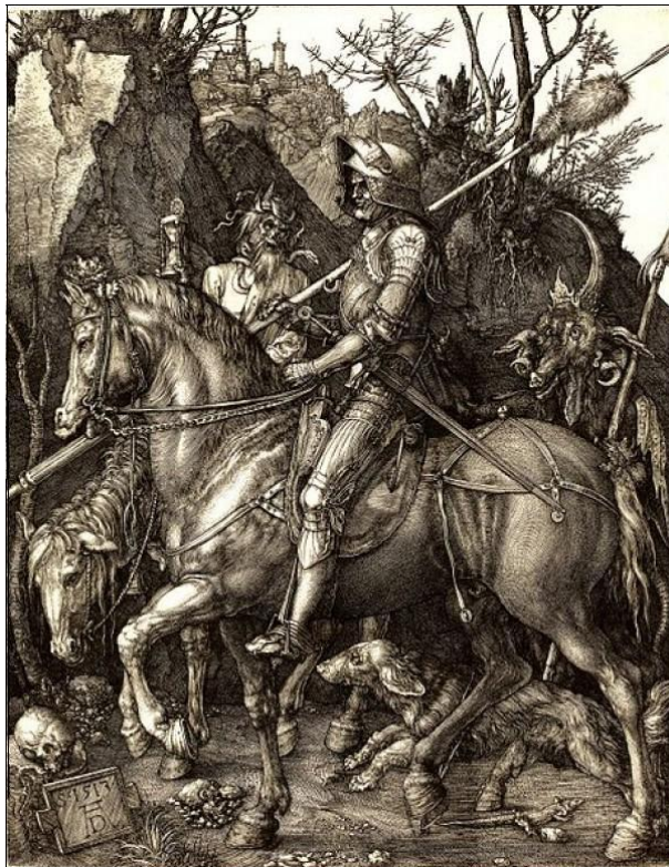
„Витез, смрт и ђаво“, Албрехт Дирер 1513-14.

У свему што човек чини, одувек и заувек, на крају, ипак, остају само два избора: култура или дивљаштво, уметност или баналност, божанско или анимално, стваралачко или рушилачко, живот или ништавило... - Донкихотство и испуњеност или Раскољниковство, тривијалност, беспуће, бесмисао и празнина.