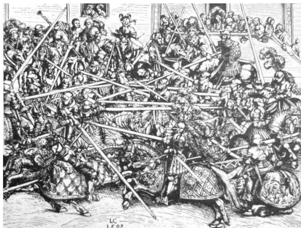
Лука Карнах Старији, графика из 1509. године која приказује турнир у правом (неспортском) светлу - као маневарску војну битку.

Турнирске битке нису биле спорт још из једног разлога. Наиме, оне веома често уопште нису имале „победника“. Замислите турнир у коме 20 или 50 витезова воде борбе. Исход оваквих борби је, како то Кординас пише ( Повратак из Јерусалима ) препричавајући речи једног анонимног свештеника, који ужасавајући се над „безбожним“ насиљем каже да „... сви су понаособ били или толико израђављени и повређени да се борити више нису могли, или су се многи најбољи међусобно поубијали или тешко у жару борбе повредили. Тако су преостали, а многи од њих и слаби борци, који су се као кукавице пазили и крили, што нису имали ни с ким, ни воље да с неким наставе даље се борити. “