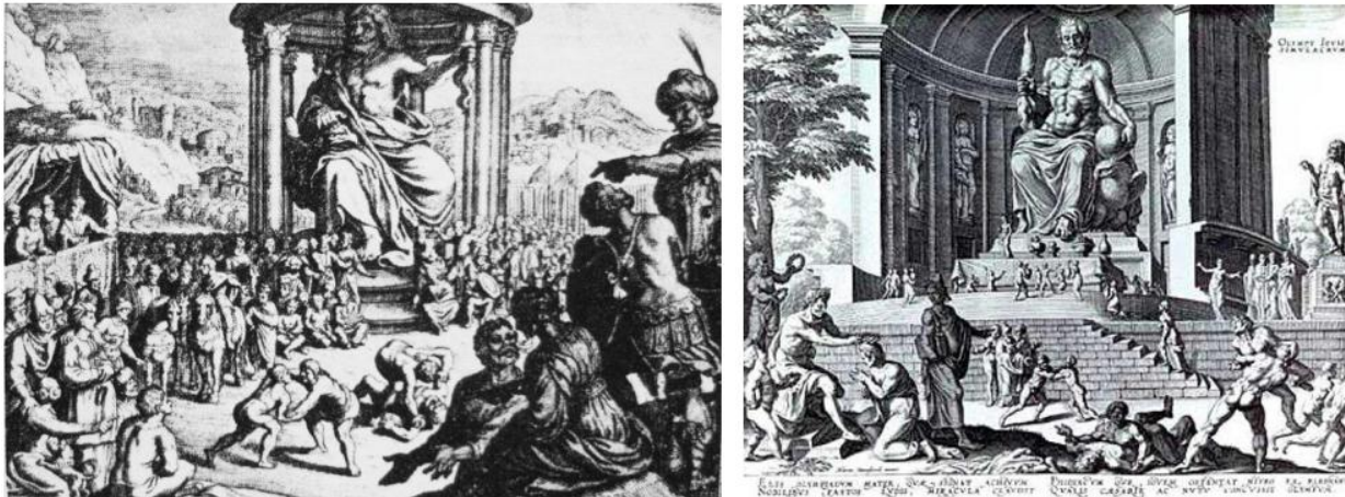
Античке Олимпијске игре пред Зевсовим храмом

Та надметања су организована као химне, окупљања највиђенијих атлета, песника, писаца, говорника..., а са циљем придобијања наклоности Зевса (јер „ Богови воле игре “ - Пиндар) те величања његове славе кроз сопствену вештину и врлину, а не због спортско-такмичарских победа, славољубља и тријумфалистичке егоманије.