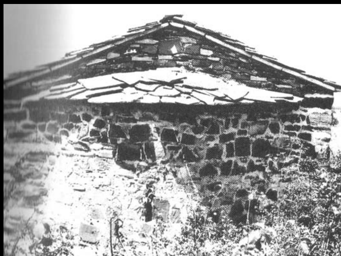
Источна фасада цркве са олтаром пре рушења