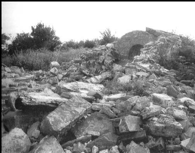
Рушевине цркве, поглед са југозапада