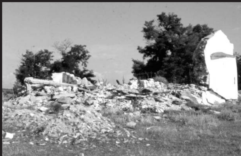
Рушевине цркве и припрате, поглед са југа