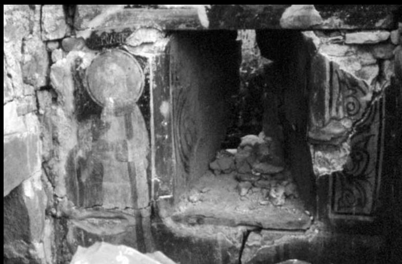
Остаци фресака на јужном зиду наоса

Fresco mortar around the cracks has mostly fallen off. Although there are areas in which fresco mortar is still fairly well attached to the support, the major part of it is detached and likely to fall off – along the borders of the recent damages in particular. Lime mortar fillings applied in 1968 on the borders of damages are still well attached to the fresco mortar, which enables us to make a clear distinction between the old damages and the recent ones.