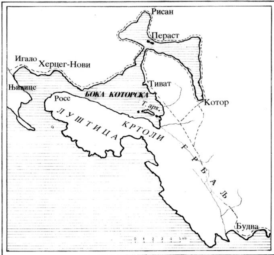
Савремени називи градова и мјеста који су споменути у тексту