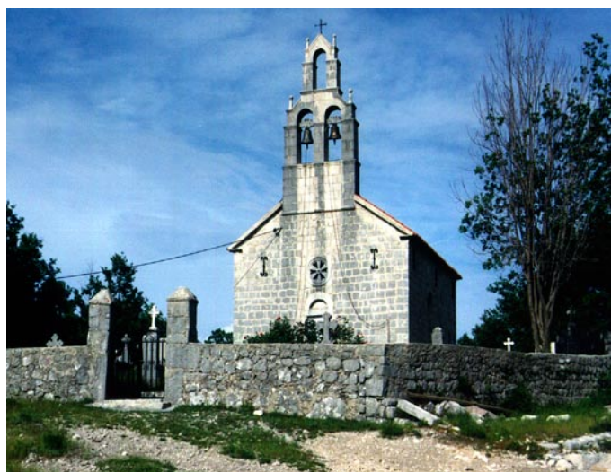
Црква св. Јована, Драгошево село Поглед на цркву са гробљем