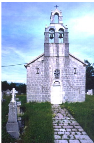
Црква св. Јована, Драгошево село Изглед западне фасаде