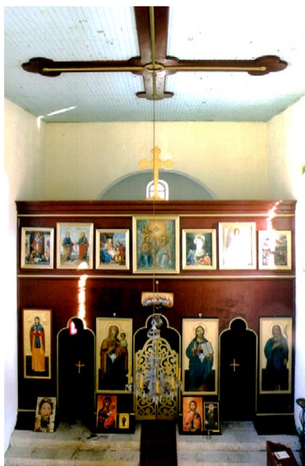
Црква Покрова Богородице, Драгаљ Изглед унутрашњости цркве

техника зидања разликују је од архитектуре осталих сеоских кривошијских цркава.