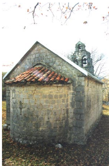
Црква Рождества Богородице, Малев до Изглед источне фасаде