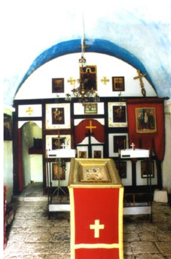
Црква Рождества Богородице, Малев до Изглед унутрашњости цркве са иконостасом