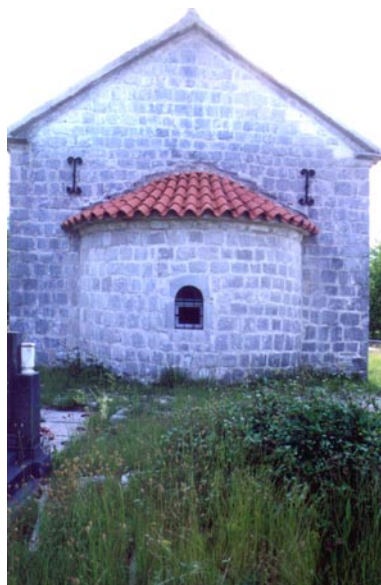
Црква св. Јована, Драгошево село Изглед источне фасаде