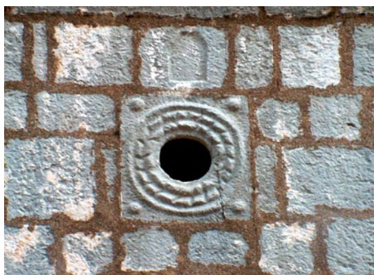
Црква Рождества Богородице, Малев до Детаљ рељефних украса на западној фасади звоника