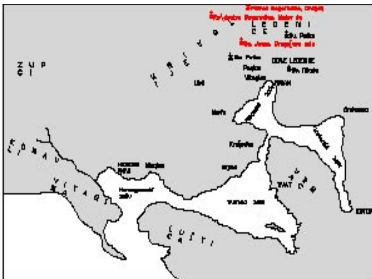
Карта Боке са означеним положајем цркава на Кривошијама и Леденицама

У првом делу рада, објављеном у зборнику Бока бр. 23, приказано је истраживање цркава: