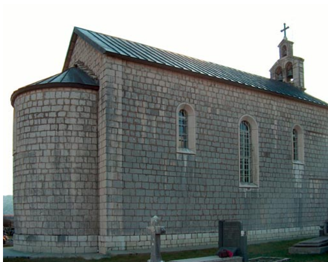
Црква Покрова Богородице, Драгаљ Поглед на североисточни угао цркве