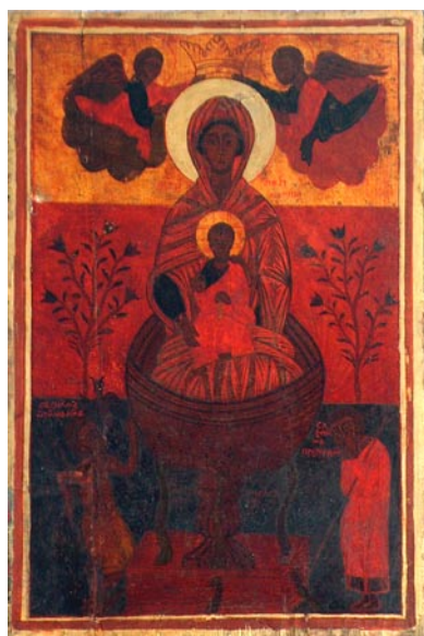
Црква Рождества Богородице, Малев до Икона „Крунисање Богородице”