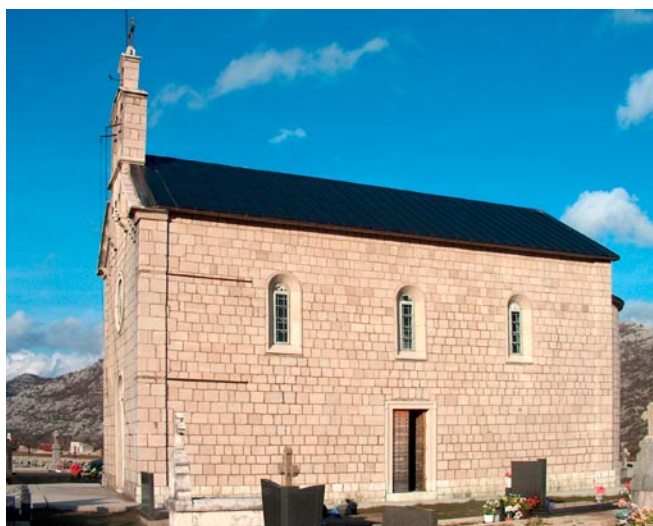
Црква Покрова Богородице, Драгаљ Изглед јужне фасаде