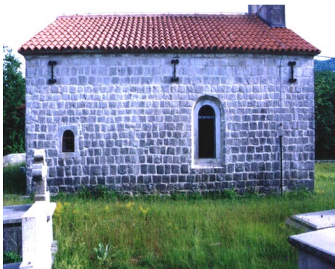
Црква св. Јована, Драгошево село Изглед северне фасаде