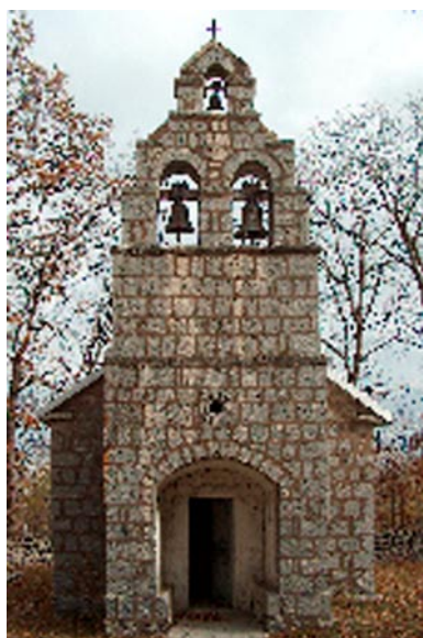
Црква Рождества Богородице, Малев Изглед западне фасаде