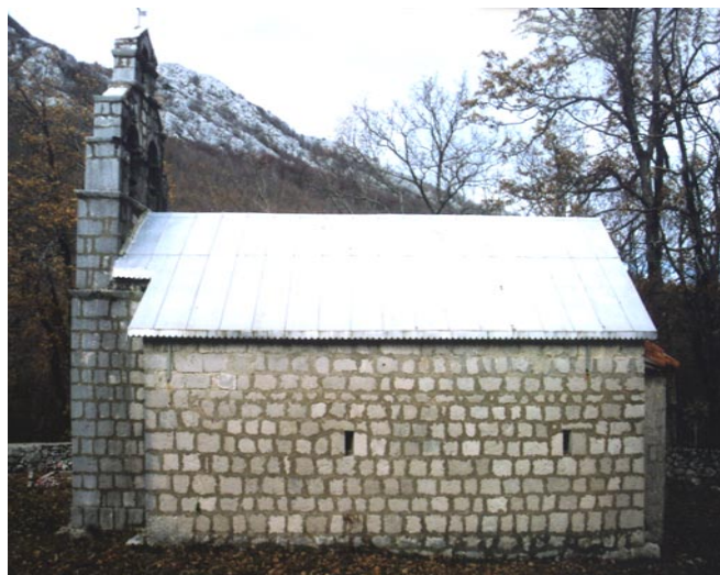
Црква Рождества Богородице, Малев до Изглед јужне фасаде