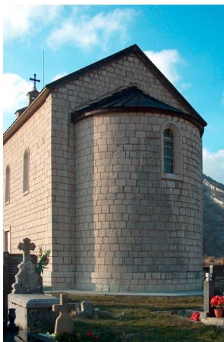
Црква Покрова Богородице, Драгаљ Изглед источне фасаде