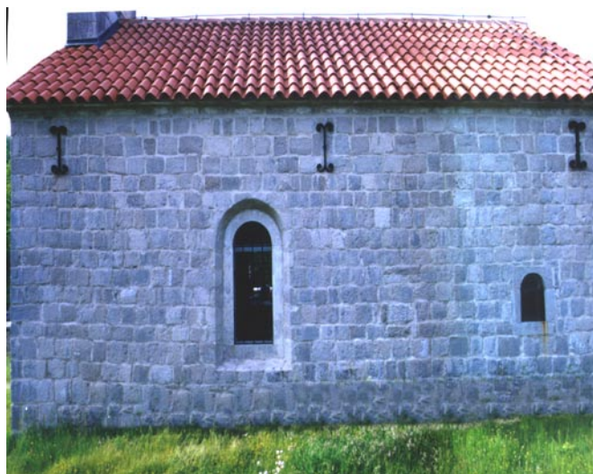
Црква св. Јована, Драгошево село Изглед јужне фасаде